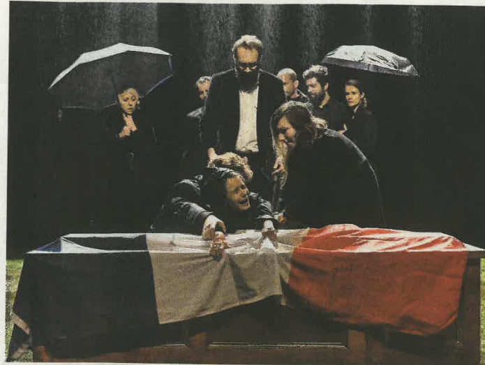
“Jusque dans vos bras” at the Théâtre des Bouffes du Nord in Paris.

Mr. El Khatib has been prominently featured at this year’s Festival d’Automne à Paris, a large-scale, multidisciplinary event founded in 1972 that brings performances and exhibitions to